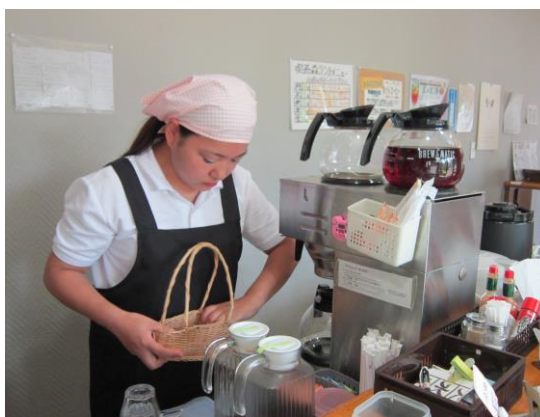
喫茶での接客作業