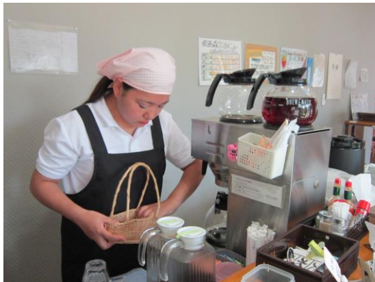
喫茶での接客作業