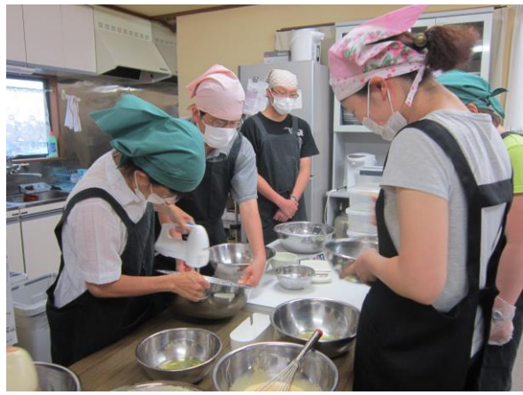
パティシエクラブ(アイスクリーム)