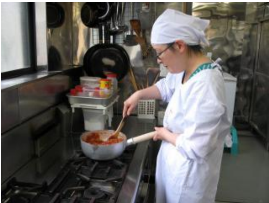
厨房での調理補助作業

おもな作業は、昭島市役所1階「喫茶森」での接客と、厨房での調理(補助)、封入等の軽作業です。健康状態に気を配りながら、無理をせず、マイペースで働くことができます。ゆいのもり田中町は、原則としてシフト制です。一般就労とはちがひ、病気と付き合いながら、それぞれの課題に取り組む一人ひとりが、働きやすくなるように、相談しながらシフトを組んでいきます。