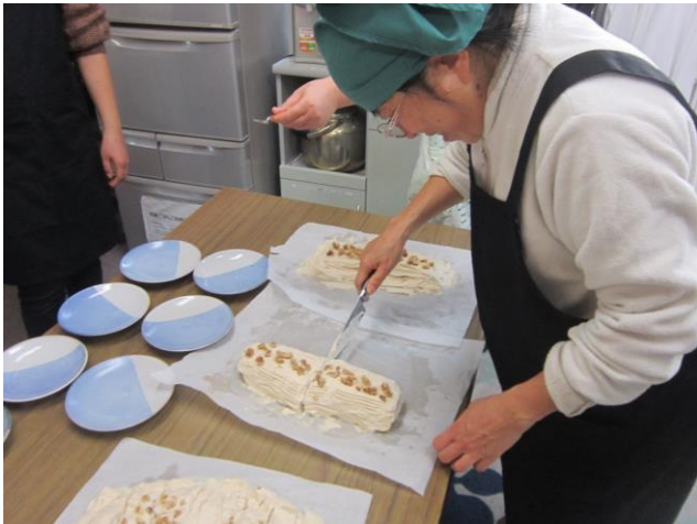
パティシエクラブ ブッシュドノエル作成